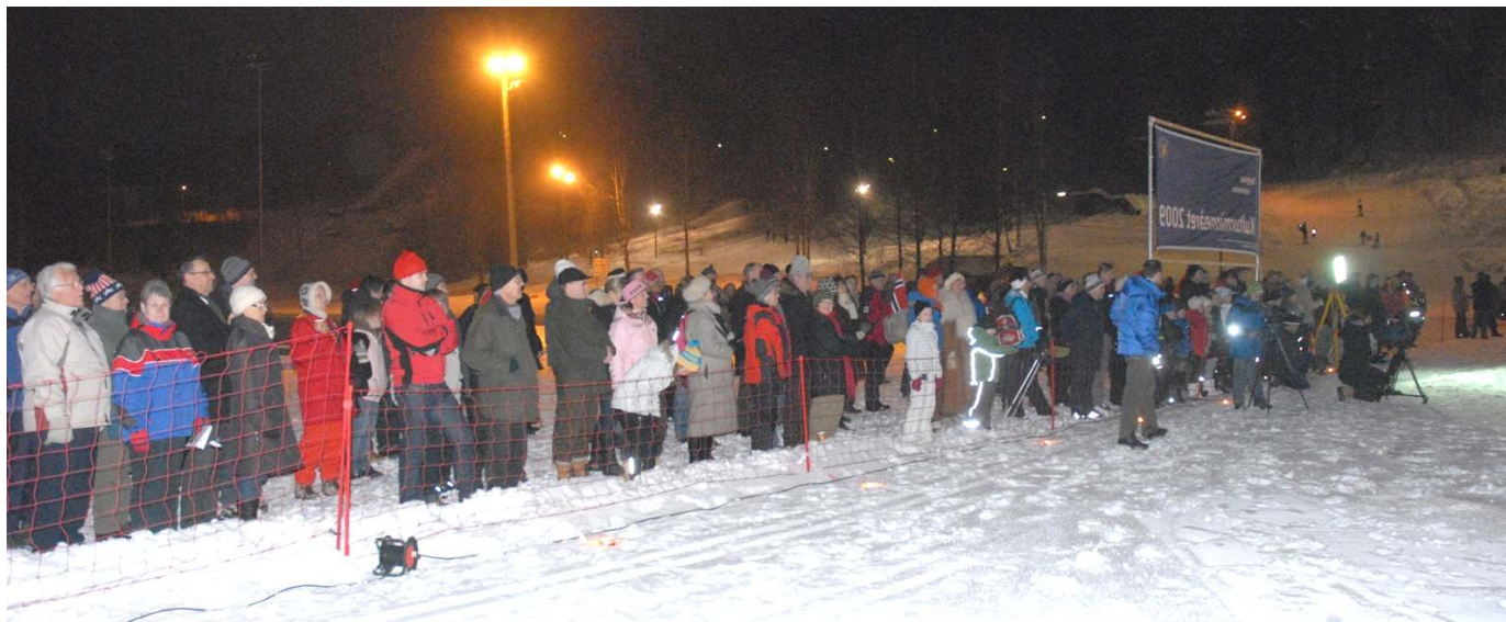
Tilskuere i Skuibakken igjen, Fredningsseremonien 24.2.2009