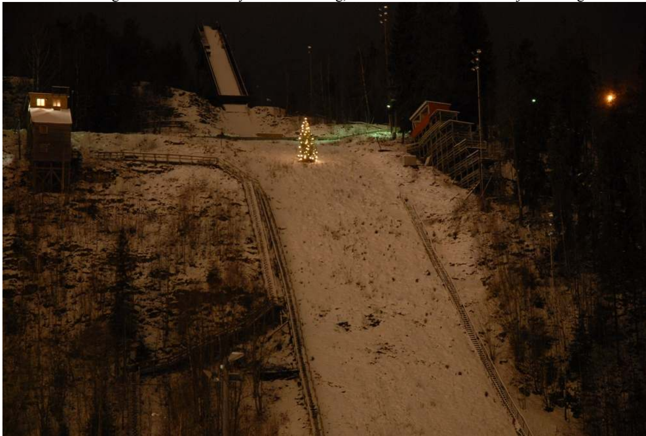
Juletreet tent i Skuibakken

1. søndag i advent var det, som den nye tradisjonen tilsier, juletretenning med hyggelig bistand av Skui Brass bands nisseorkester og bakken i fullt flomlys. God stemning, hvor fint vintervær avløste fjorårets regnvær!