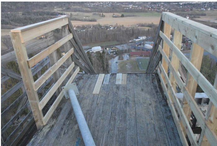
Nytt rekkverk og reparerte plattinger i fartsstillaset