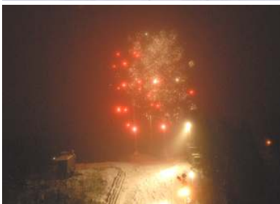
Fyrverkeri i Skuibakken