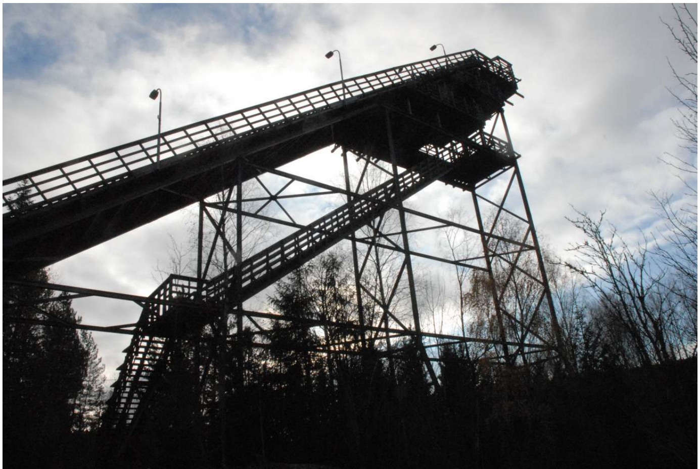
Fartsstillaset er imponerende og setter tankene i sving.

Det er veldig morsomt å registrere den glød og positive interesse som har kommet frem etter initiativet ble tatt. Det er helt klart at Skuibakken er et kulturhistorisk monument og landmerke kjent både nasjonalt og internasjonalt, hvor mange har dype røtter og et forhold til. Bevaring av et slikt anlegg er et unikt idrettshistorisk interessant og nytt prosjekt ingen før har gjort. At bakken oppnådde fredningsstatus understreker Skuibakkens betydning.