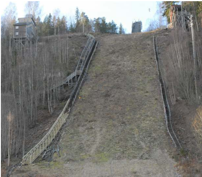
Ny søndre måletrapp