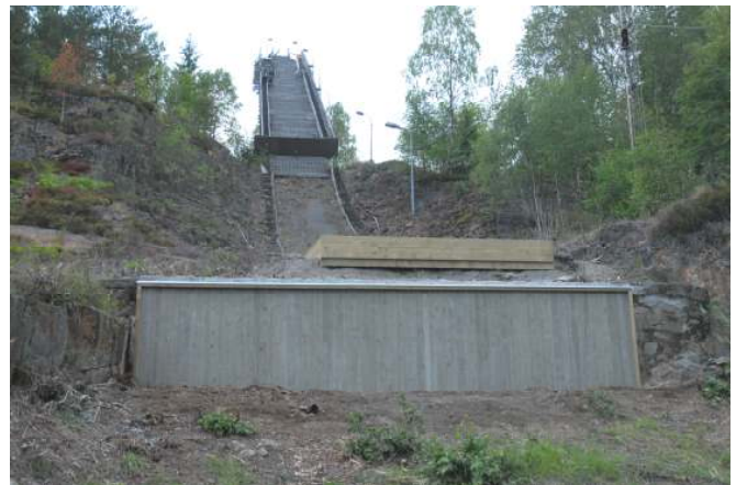
Hoppet og hoppkanten er restaurert og presentabelt igjen.