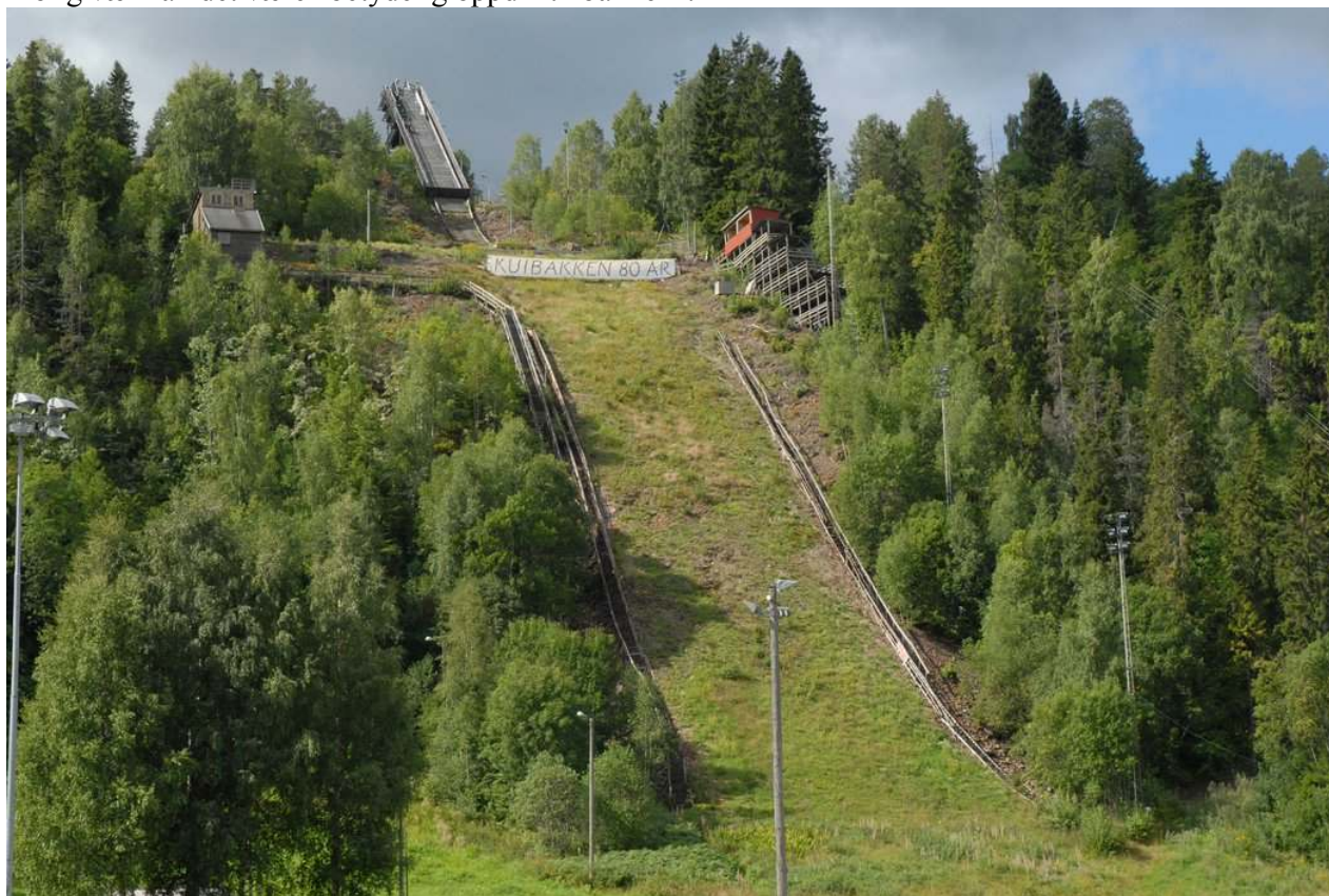
SKUIBAKKEN 80 ÅR, 2008. Første renn var 18. mars 1928

18. mars 2008 var det 80 år siden bakkens innvielsesrenn. Dette ble markert ved at det ble hengt opp et stort seil med "SKUIBAKKEN 80 ÅR" i bakken. Interesserte fikk da en god forståelse av vindforholdene på kulen og at selv i rolig vær kan det være "betydelig oppdrift i bakken".