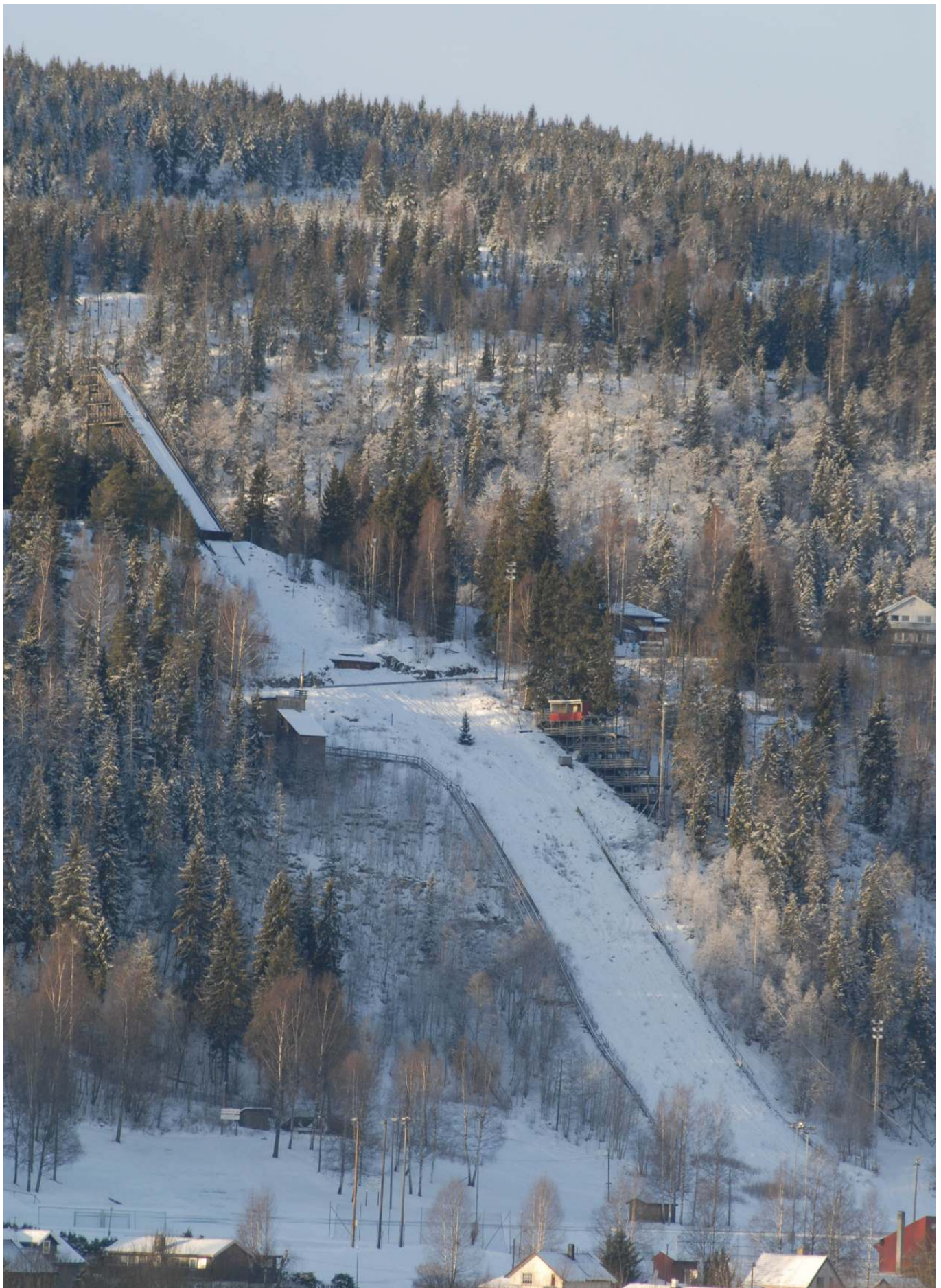
Skuibakken januar 2008