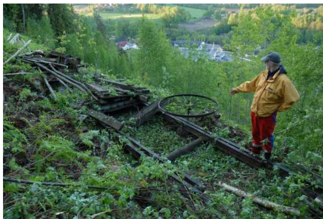
Stilanviserhjulet kom frem etter rydding

Flere strakstiltak er blitt utført: Hoppkant restaurert, sikkerhetsmessige utbedringer av fartsstillaset som har fått utbedret rekkverk og plattinger. På kongetribunen er gulv og rekkverk i adkomstvei reparert. Det største restaureringsprosjektet var fornyelse av søndre måletrapp slik at den også brukes som trimtrapp. Den ble umiddelbart tatt i bruk og var også viktig under fredningsarrangementet. Flere fremtidige tiltak er planlagt: Løpebanen i fartsstillaset, elektrisk utstyr og anlegg og dommerhuset. Det er også planer om historiske skilt og