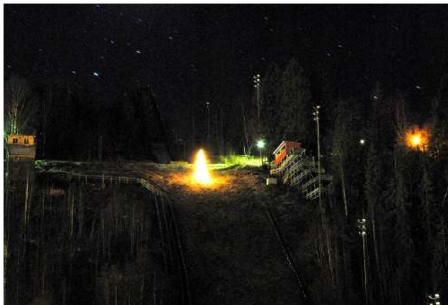
Julegranen lyser opp