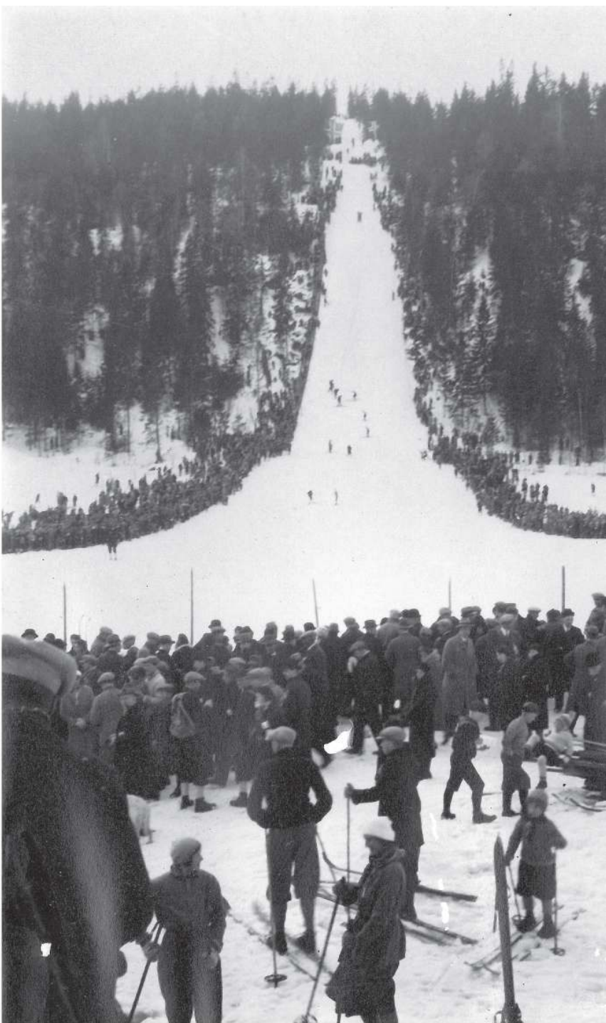
SKUIBAKKEN 1931: Flere tusener mennesker omkranset sletta.

– Det var den gangen man måtte preppe eller bein- trække bakken manuelt, humrer hun.