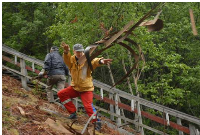
Ryddedugnad før 17.mai