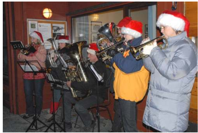
Skui Brassbands Nisseorkester

Årets tradisjonelle arrangement, første søndag i advent, ble gjennomført med en større gran og mer lys. Nå plassert i permanent fot på kulen. Stjerneklart vintervær forsterket den gode stemningen. Skui Brassband skal igjen ha takk for profesjonell fremføring av kjente og kjære julemelodier, og kombinert med varm gløgg og pepperkaker, fikk en tallrik forsamling Skuibakke-entusiaster virkelig en forsmak på julen.