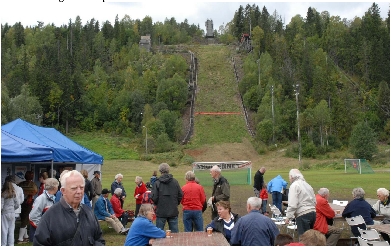
Kulturminnearrangement med utstilling 15.sept 2008

Skuibakken ble Bærum kommunes offisielle arrangement. Det ble hopphistorisk utstilling, musikk ved Skui Juniorkorps, rebusløp, omvisning, utstilling av 2 1928 årgang biler, og for de yngste, besøk av ”Gråtass”, hest med slede og muligheten til å prøve taktfast gange på felles ski.