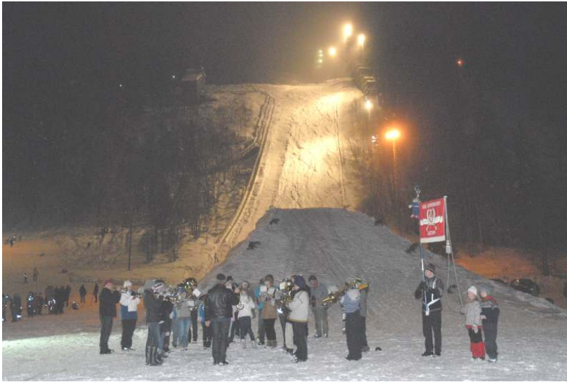
Skui Juniorkorps og Skui Brassband holder konsert etter innmarsj på sletta.

Se innlegg fra fredningsfesten i Budstikka: