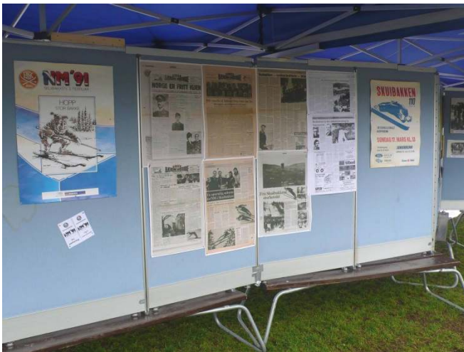
Skuibakken hopphistorisk utstilling