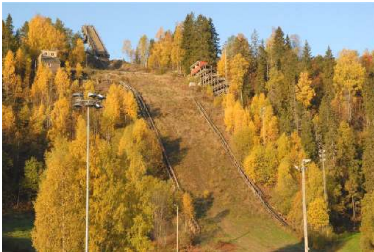
Skuibakken i høstfarger – Bakken var sentrum for kulturminnevandring i november 2009