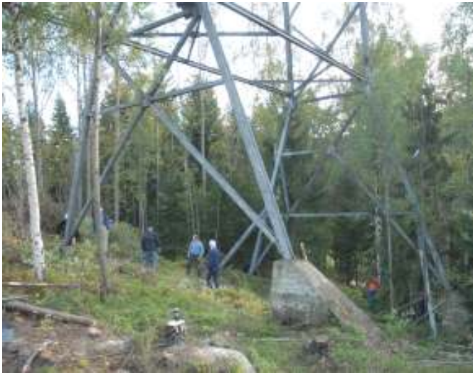
Det lysner under de store konstruksjonene

Vedlikeholds- og dugnadskomiteen. Å få satt bakken i stand har avgjørende betydning for mulighetene for aktivitetene i bakken. Det har vært flere dugnader med kvistfjerning og opprydning.