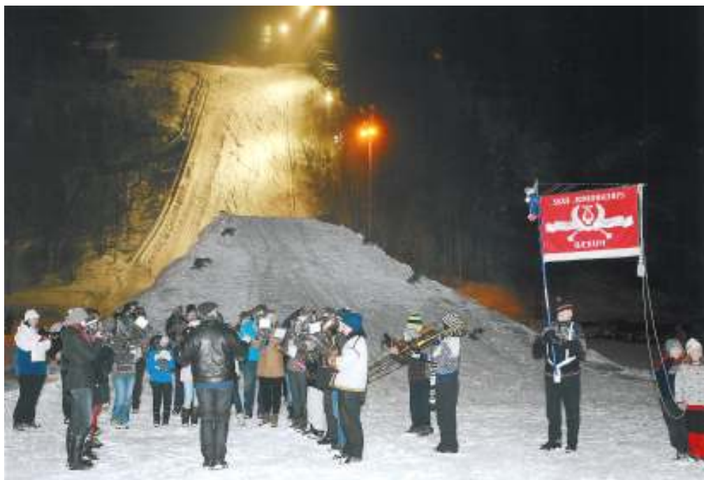
Skui Juniorkorps og Skui Brassband holder konsert etter innmarsj på sletta.

En stor takk også til alle hjelpere fra Bærum kommune, IL Jutul, våre to musikkorps Skui Juniorkorps og Skui Brassband, Røde kors og ikke minst de mange frivillige som sørget for at dette gikk smertefritt.