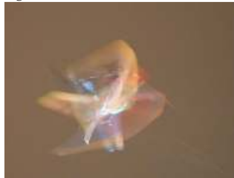
Jibbe kunst på twin-tip ski