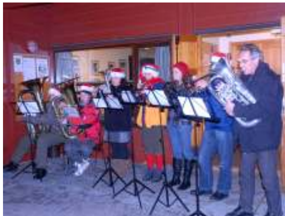
Skui Brassbands Nisseorkester

Årets tradisjonelle arrangement, første søndag i advent, ble gjennomført med en større gran og mer lys. Nå plassert i permanent fot på kulen. Skuibakken i flomlys viste seg frem med nye pærer i ovarennet. Skui Brassband skal igjen ha takk for profesjonell fremføring av kjente og kjære julemelodier. Kombinert med varm gløgg og pepperkaker og juletale, fikk små og store i en tallrik forsamling Skuibakke-entusiaster virkelig en forsmak på adventstiden. Riktignok uten sne, men appellen virket og den kom dagen etter og ligger enda!