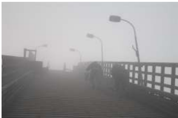
Lysgjengen på arbeid –