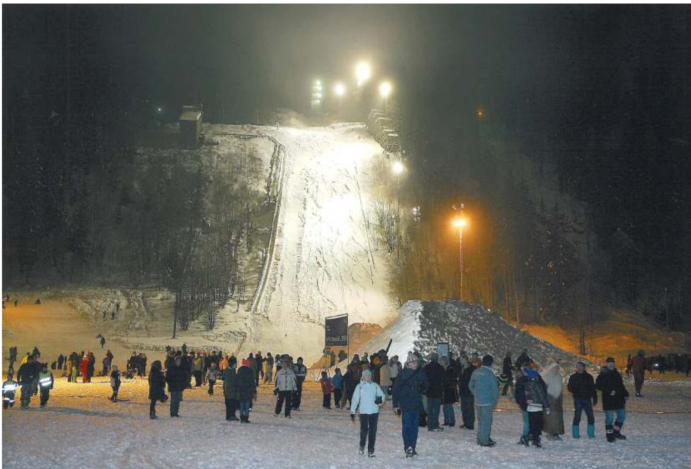
Folkefest på sletta under Frednings seremoni 24. februar 2009

I kulturminneåret 2009 ønsket som kjent Riksantikvaren å frede 12 kulturminner. Akershus fylkeskommune foreslo Skuibakken. Forslaget ble valgt av sentrale myndigheter og etter en høringsprosess og positiv innstilling fra Bærum kommunestyre ble Skuibakken fredet 24. febr 2009 som det eneste fra Akershus og eneste idrettsanlegg. Dette gjorde at vi fikk betydelig oppmerksomhet både fra Aftenposten, NRK Østlandssendingen og fra Budstikka som begge sendte TV innslag både da forslaget ble kjent og ikke minst fra fredningsseremonien hvor det igjen var hopp i bakken. Nå riktignok på sletta med "Bigjump" og twin-tip ski, med saltoer og piruetter.