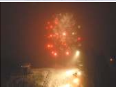
Fyrverkeri i Skuibakken