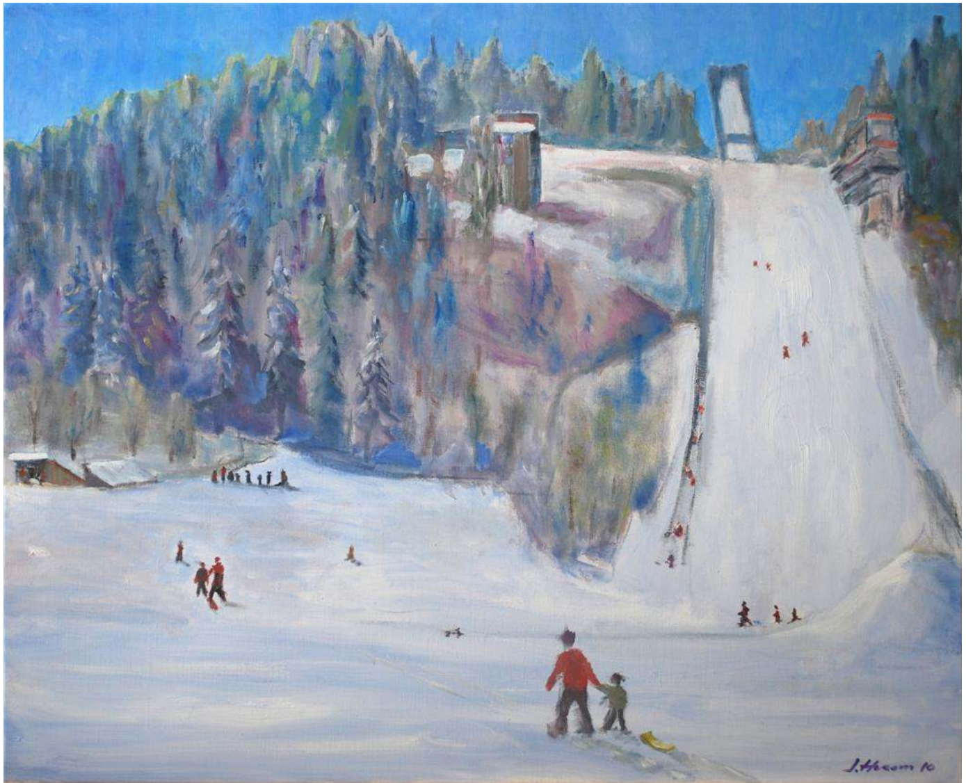
Skuibakken med Skileiken IL Jutul – Arena for mye moro og glede