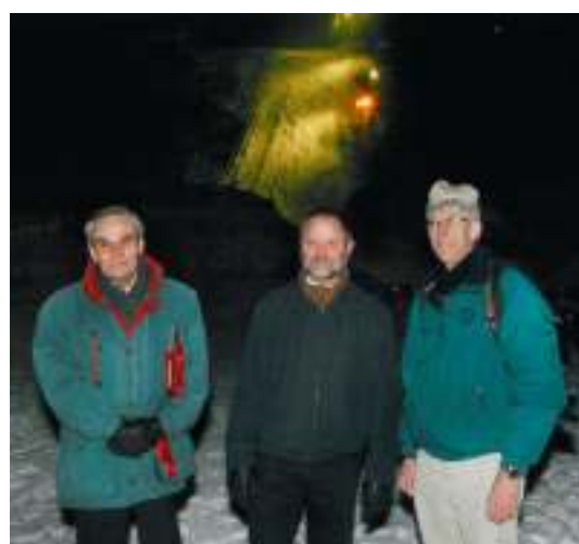
Ordføreren, Riksantikvaren og leder SBV