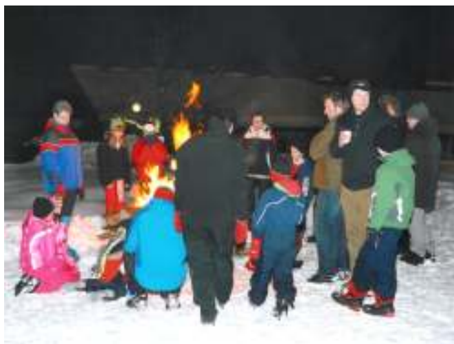
Bålvarme på sletta