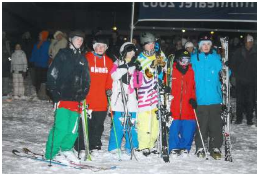
Jibbere i Skuibakken