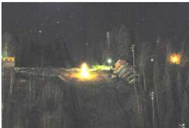
Julegranen lyser opp