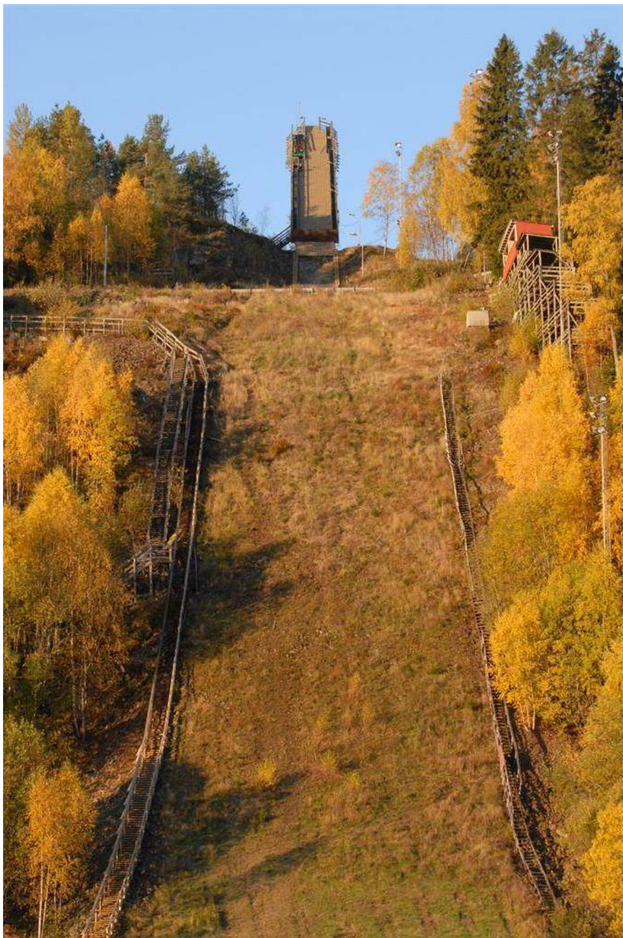
Skuibakken oktober 2009