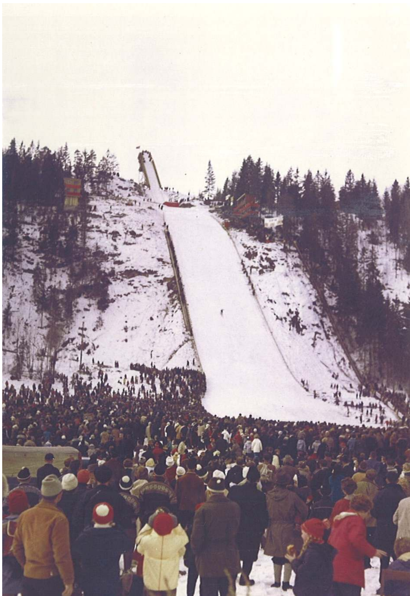
Skuibakken, NM stor bakke, 8. april 1963. Første renn etter tredje ombygning.