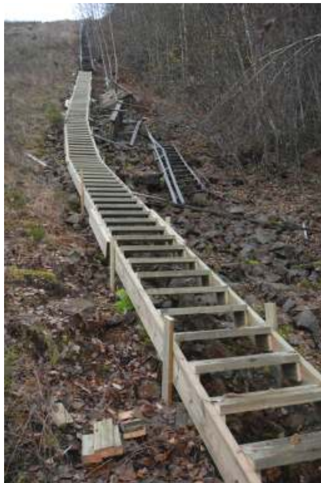
Nordre trimme og måletrapp under arbeid.

For alle utskiftninger og vedlikehold er det lagt vekt på samme utseende og materialdimensjoner som før.